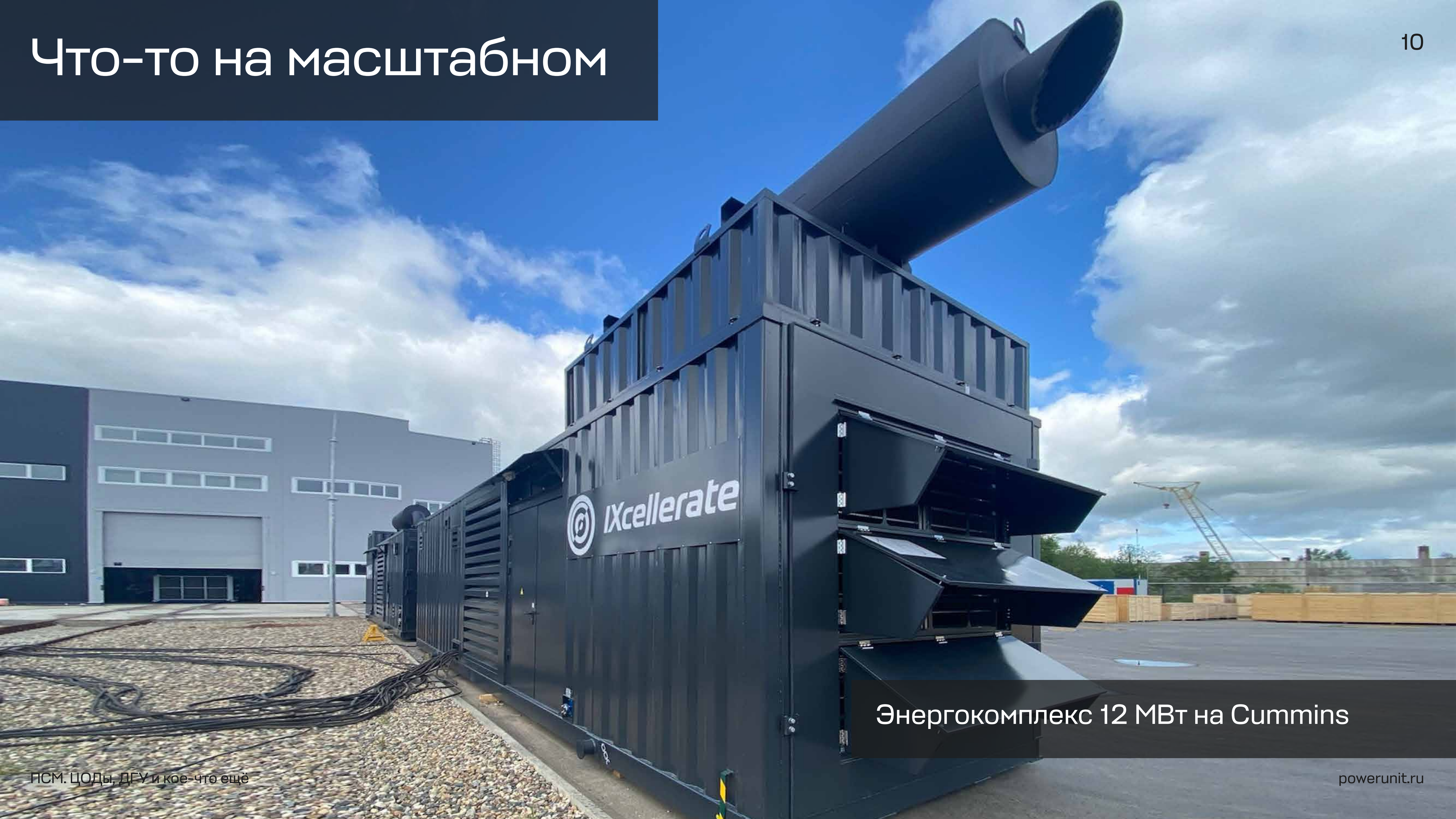
Энергокомплекс 12 МВт на Cummins