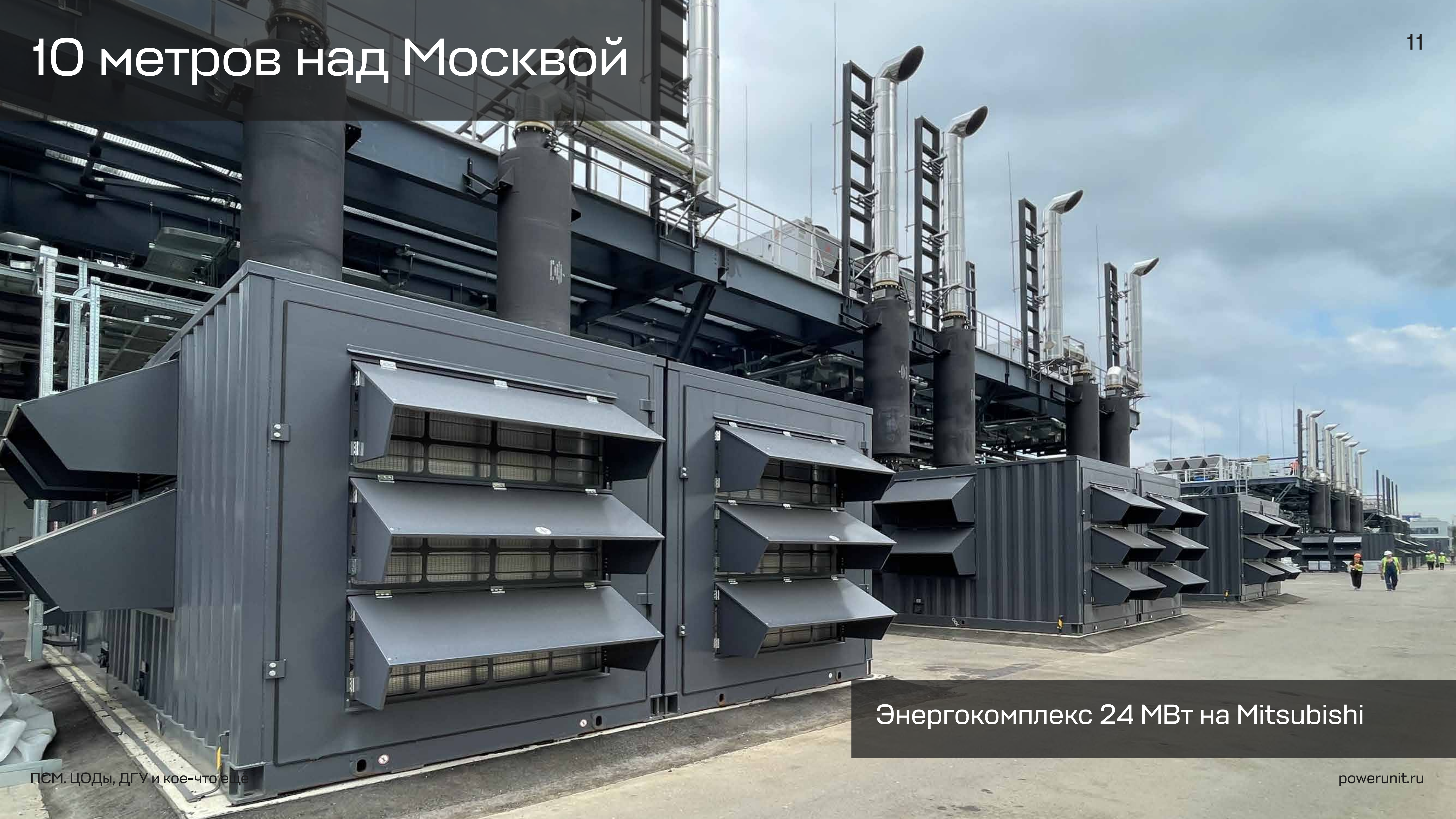
Энергокомплекс 24 МВт на Mitsubishi