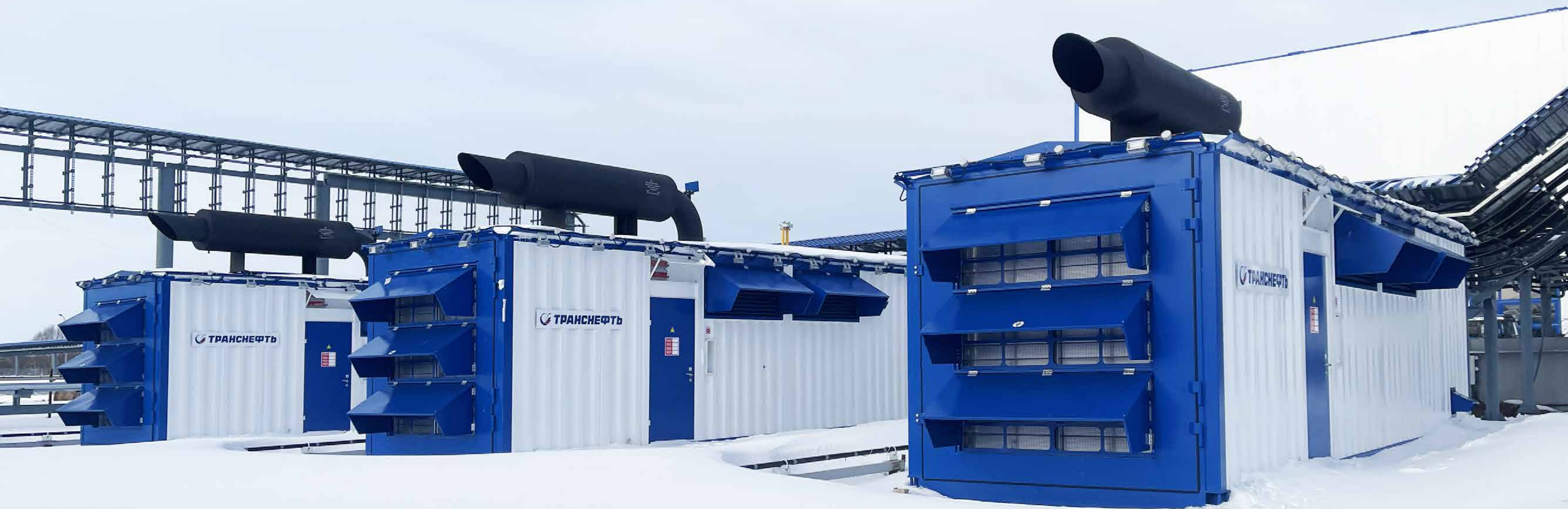
Энергокомплекс 5,4 МВт на Mitsubishi